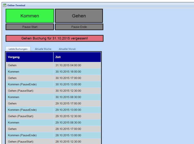
Abb.: Zeiterfassung über Online-Terminal